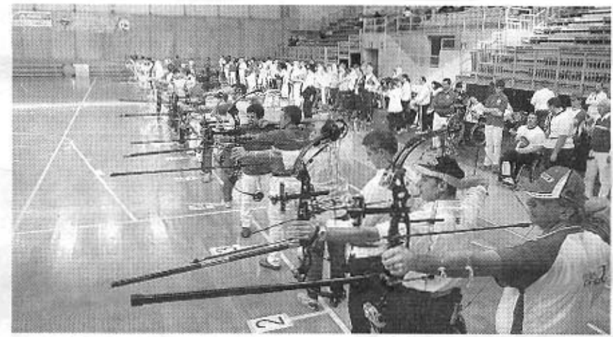
Una fase della gara di tiro con l'arco di Sedico